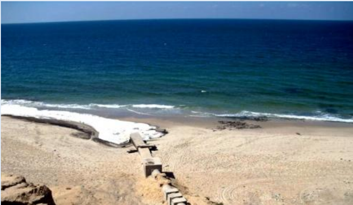
Door de Israëlische blokkade is er een tekort aan materieel voor de waterzuivering. Daardoor stroomt rioolwater niet of nauwelijks gezuiverd de zee in. Het zeewater raakt ernstig vervuild.

De waterzuiveringcapaciteit in Gaza ligt ver beneden het minimum. De delegatie bezocht de plek waar elke dag meer dan 50 miljoen liter rioolwater de zee instroomt. Dit rioolwater is slechts matig gezuiverd. Bij een ander riool, ten zuiden van Gaza-stad, stroomt dagelijks 12-15 miljoen liter de zee in, zonder zuivering. Het derde riool, in het zuiden van de Gazastrook, voert water af dat beter gezuiverd is.