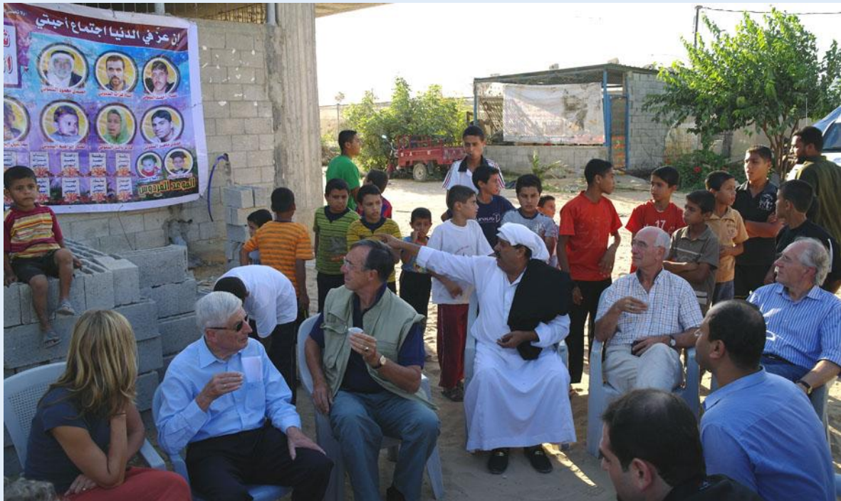
Een lid van de al-Samouni familie dat het Israëliëse bombardement heeft overleefd, geeft uitleg.