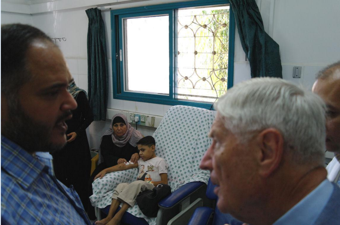
De delegatie bezoekt het al-Shifa-ziekenhuis. Op de achtergrond een jongen van 15 die dringend een niertransplantatie nodig heeft, maar door geldtekort niet kan krijgen.

Tot slot bezocht de delegatie het Gaza Community Mental Health Programme (GCMHP), opgezet door de Palestijnse psychiater Eyad al-Sarraj. Dit programma bekommert zich om de vele Gazanen die ernstig getraumatiseerd zijn, waaronder veel kinderen. Een medewerker vertelde dat 20-25% van de schoolgaande jeugd aan een mentale ziekte lijdt, merendeels te wijten aan traumatische ervaringen, zoals marteling van de vader, extreem geweld en grote armoede.