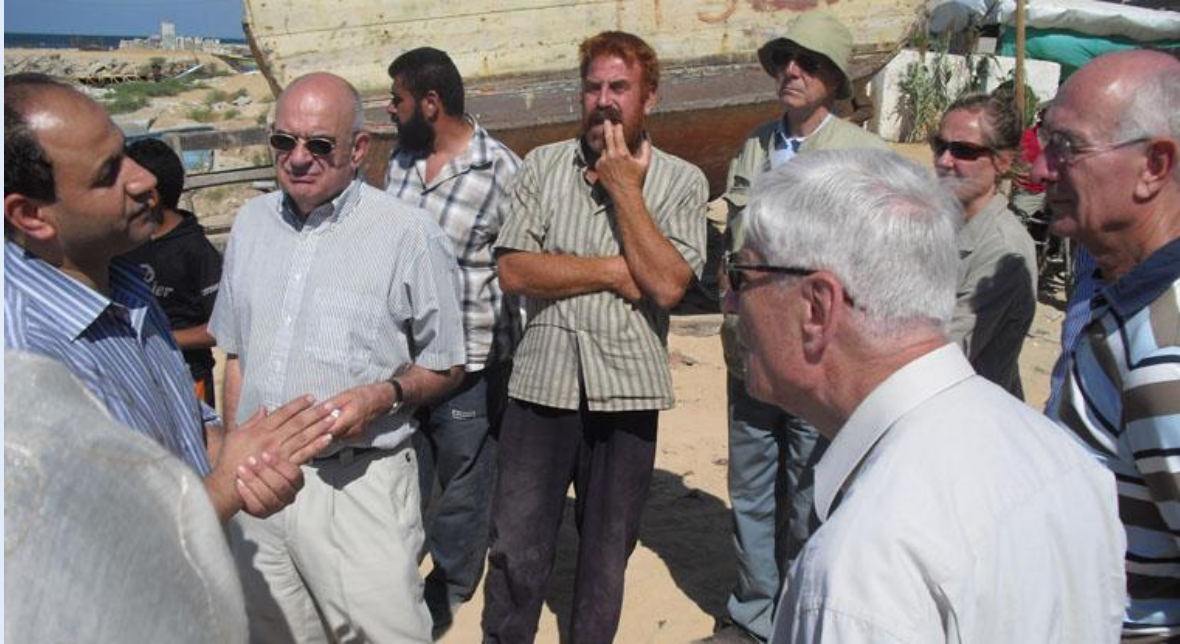
Palestijnse vissers informeren de delegatie over beschietingen door de Israëlische marine. In strijd met gesloten akkoorden mogen de vissers slechts 3 mijl de zee op.