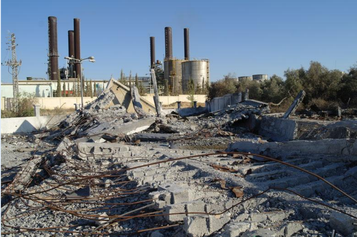
De schade van een Israëlische aanval op een pompstation, die in juli 2011 plaatsvond. Op de achtergrond de enige elektriciteitscentrale van Gaza, die in 2006 en gedurende de aanval van 2008-09 door het Israëlische leger is gebombardeerd.

Het pompstation is gelegen naast de enige elektriciteitscentrale in de Gazastrook, die bij Israëlische bombardementen in 2006 grote schade heeft opgelopen. Tijdens de aanval in 2008-09 is de centrale wederom zwaar beschadigd.