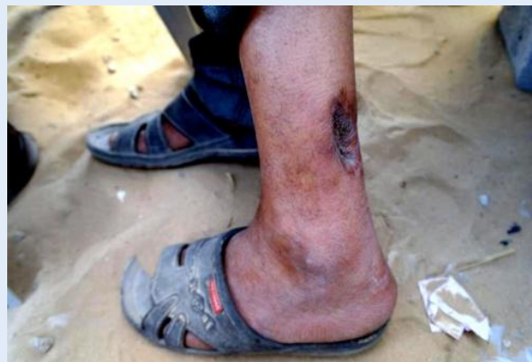
Palestijnen tonen letsel, veroorzaakt door Israëlische aanvallen.

De delegatie sprak een familie die in gebied woont dat regelmatig door Israël wordt beschoten. Zij werd met diepe teleurstelling en bitterheid geconfronteerd, toen de moeder van het gezin zei: "U komt en gaat, en ik blijf met mijn kinderen bij de frontlinie achter."