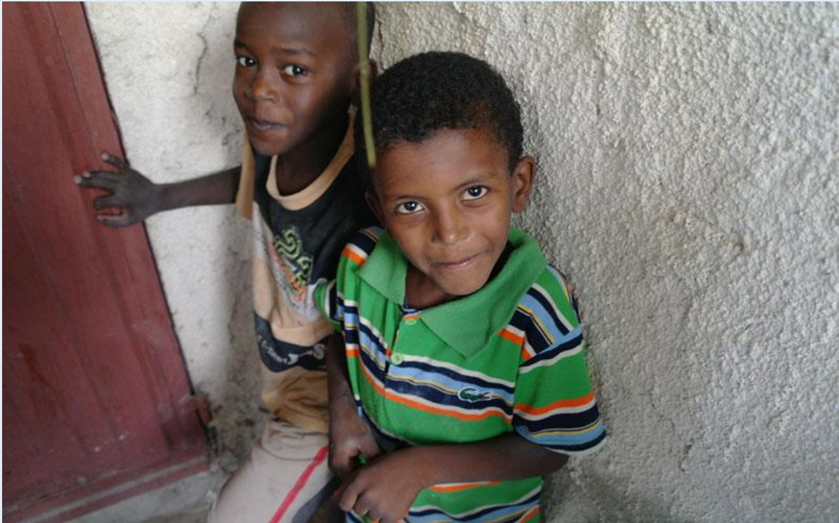
Palestijnse kinderen in een vluchtelingenkamp.

Donorgelden gaan in de regel naar noodhulpprojecten. Strategische projecten worden niet uitgevoerd; een structurele aanpak ontbreekt.